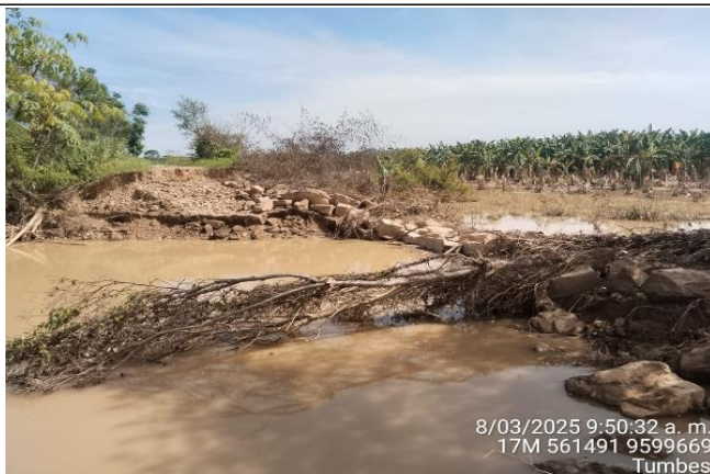
FIGURA N°02: CULTIVOS DE PLÁTANO AFECTADOS POSTERIOR AL DESBORDE DEL RÍO TUMBES.