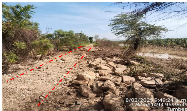
FIGURA N°01: TRAMO CRÍTICO EN EL RÍO TUMBES, EN EL SECTOR CRISTALES, DISTRITO DE CORRALES, PROVINCIA DE TUMBES.