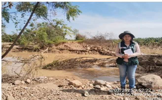
FIGURA N°03: TROCHA CARROZABLE EROSIONADA POSTERIOR AL DESBORDE DEL RÍO TUMBES EN EL SECTOR LOS CRISTALES.